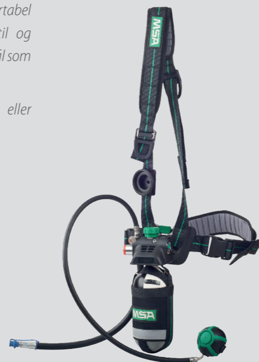
PremAire Combination Mini