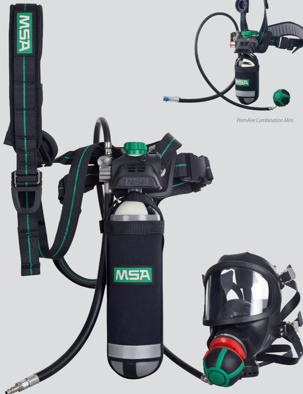
PremAire Combination med 3S-PS-MaXX og AutoMaXX-AS